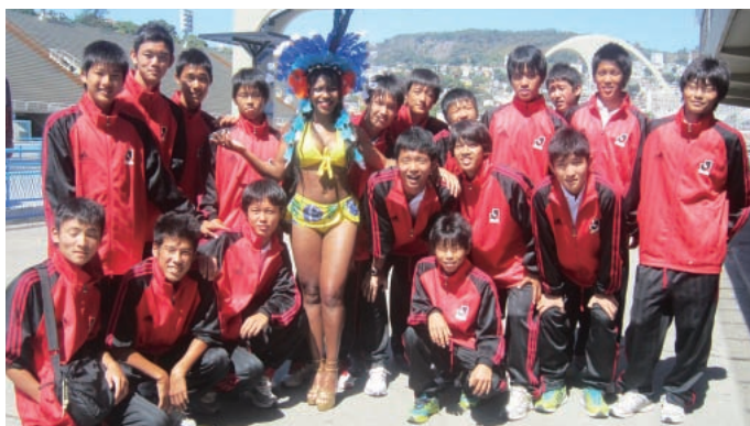
リオデジャネイロ市内を見学。サンバカーニバルが行われる会場を訪れて記念撮影