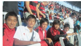
ブラジル全国選手権の試合を観戦