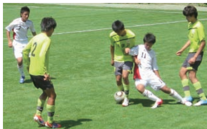
釜山アイパークとのトレーニングマッチ(白がU-16選抜)