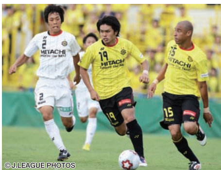
柏(黄)は弟分の柏U-18に貫録勝ちを取めた

第92回天皇杯全日本サッカー選手権大会が9月1日にスタートし、J1・J2のチームは同8、9日の2回戦から登場した。本大会には、都道府県代表の47チーム、JFLシードの1チーム、そしてJ1・J2の40チームという計88チームが参加。ノックアウト方式によって、元日に国立競技場が舞台となる決勝を目指して戦いが繰り広げられる。優勝チームには、翌シーズンのAFCチャンピオンズリーグ出場権も与えられる。