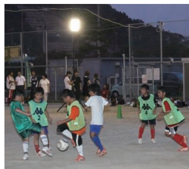
照明のもとで練習する子どもたち(岩手県大槌町)

練習をしている。すでに日が暮れた時間に練習を終えた選手たちは、「この時間でも明るい中でプレーできてうれしかった」「みんなの顔もはっきり見えて良かった」など、喜びの声を上げていた。簡易照明は、岩手県、宮城県の沿岸部12地域に対し、56台が寄贈される。