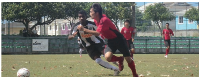
アトレチコ・ミネイロとの準々決勝は惜敗も、最後まで諦めない姿勢で戦い抜いた