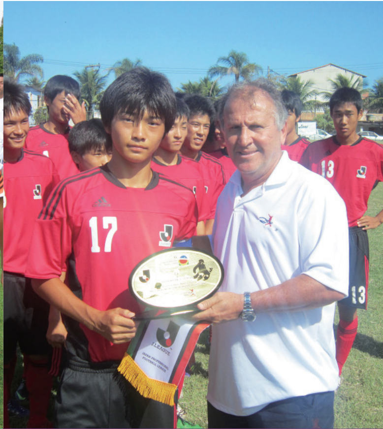
U-15 Jリーグ選抜 ブラジルキャンプ