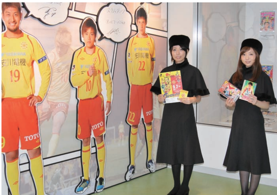
北九州市漫画ミュージアムの選手写真パネル。異なるジャンルを融合させて集客を図る