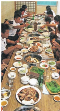
数多くの皿が並ぶ韓国料理。次第に慣れて食欲は旺盛に