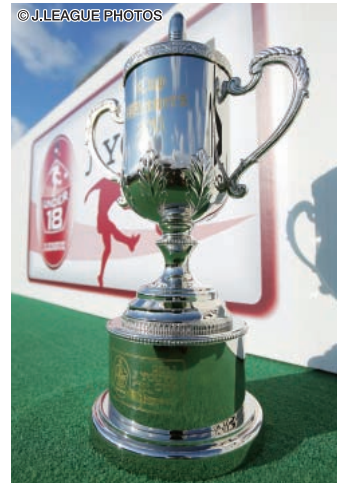
昨年の大会の優勝カップ

各予選グループ1位と2位の計20チームに、日本クラブユースサッカー連盟代表の4チームを加えた合計24チームによる1回戦トーナメント方式