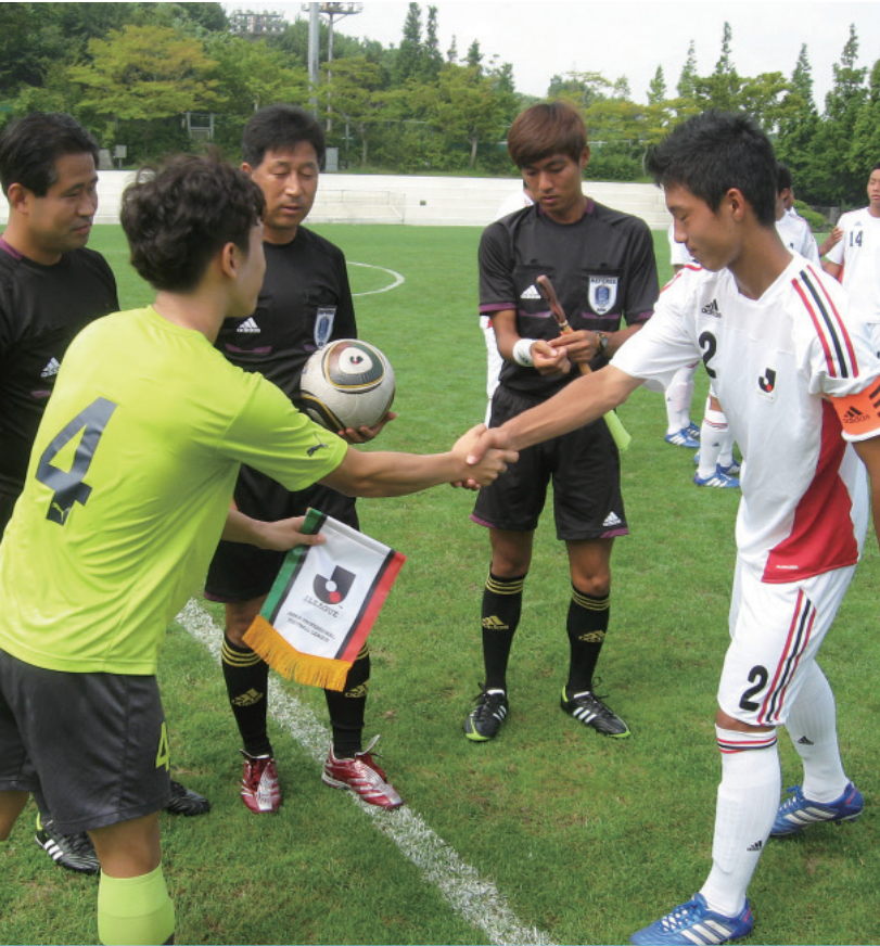
U-16 Jリーグ選抜 韓国キャンプ