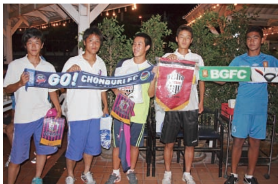
試合後の交流会で親睦を深めた両国の選手たち

セレッソ大阪とヴィッセル神戸のU-15チームが8月27~30日、タイへの遠征を実施した。ことし3月にC大阪がタイのバンコクグラスFCと、神戸が同じくチョンブリーFCと業務提携を結び、その一環として実現したもの。現地では4チームが対抗戦を行い、試合