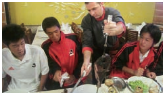
ブラジル名物のシュラスコを堪能