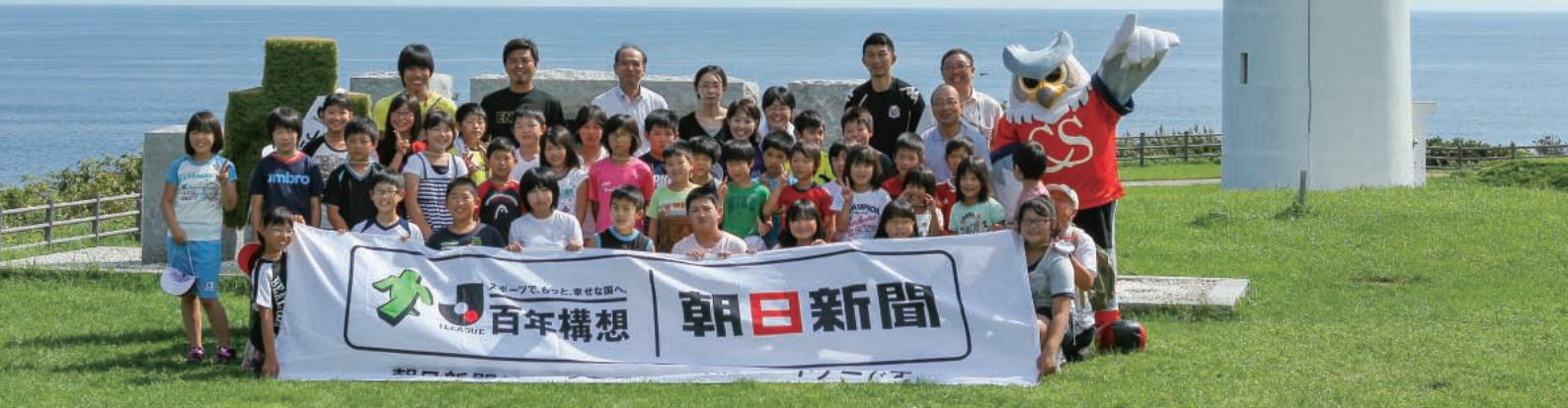
果てなく広がる太平洋をバックに、楳法華小の児童ら、参加者が記念撮影。岬に笑顔と歓声があふれる1日となった