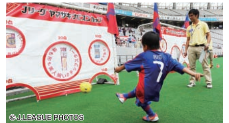
おなじみの「ナビスコキッズイレブンクラブといっしょにファイナルを目指そう!!」も開催(味の素スタジアム)