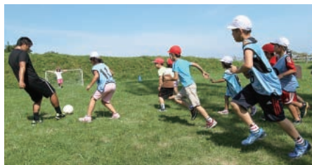
城氏も加わって、芝生の上でミニゲーム