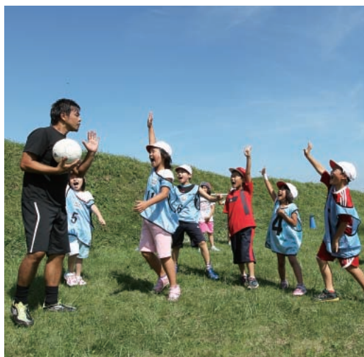
澄んだ青空のもと、子どもたちの元気な声が響き渡った