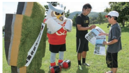
終了後にはサッカー教室の様を伝える号外が配られた