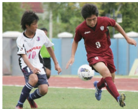
タイ側からの要請で、Jクラブ同士の対戦も実現

セレッソ大阪とヴィッセル神戸のU-15チームが8月27~30日、タイへの遠征を実施した。ことし3月にC大阪がタイのバンコクグラスFCと、神戸が同じくチョンブリーFCと業務提携を結び、その一環として実現したもの。現地では4チームが対抗戦を行い、試合