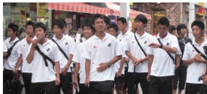
蔚山市内のアーケードを散策する選手たち