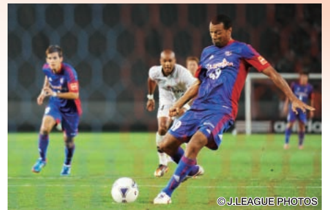
F東京はルーカスがPKを決めて清水に逆転勝ち

清水は序盤、F東京の攻勢をしのぎ、FKのチャンスを生かして相手のオウンゴールを誘