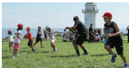
ボールを使っただけの鬼ごっこに興じる子どもたち

Jリーグは今後も、理念の一つである「豊かなスポーツ文化の振興及び国民の心身の健全な発達への寄与」を実現するため、Jリーグ百年構想に共鳴するパートナーなどと協力しながら、芝生に関連したさまざまな取り組みを推進していく。