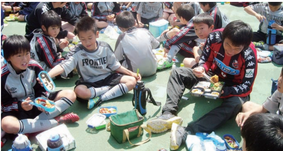
「みんなのよい食JA親善大使」のイベントで、札幌の選手と一緒に弁当を食べる子どもたち